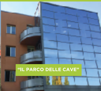
"IL PARCO DELLE CAVE"